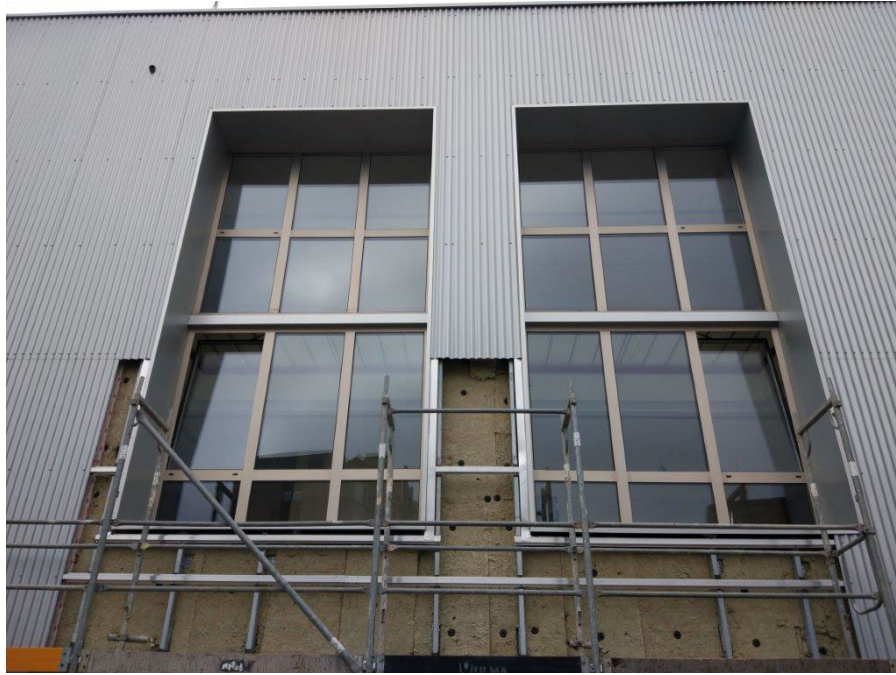
Foto 2 - Rehabilitación complejo policial Las Lonzas, La Coruña